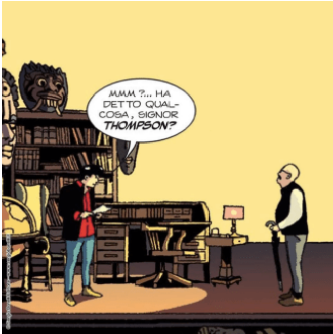
Dylan Dog

Zagor si colloca in un'™altra dimensione, il western unito a una forte componente fantastica, e non ha una precisa tracciabilitá cinematografica. Le ha invece Nathan Never , fantascienza postatomica ispirata a Blade Runner e pensata come un kolossal di fantascienza. E proprio questa monumentalitá che rende oggettivamente difficile la sua trasposizione in immagini in movimento.