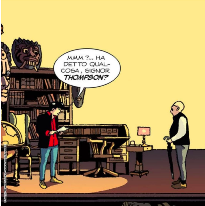
Dylan Dog

Zagor si colloca in un'â€™altra dimensione, il western unito a una forte componente fantastica, e non ha una precisa tracciabilitÃ cinematografica. Le ha invece Nathan Never , fantascienza postatomica ispirata a Blade Runner e pensata come un kolossal di fantascienza. E proprio questa monumentalitÃ che rende oggettivamente difficile la sua trasposizione in immagini in movimento.